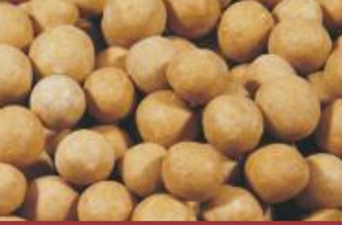
Çtır Leblebi Crispy chickpea