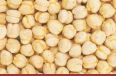
Sarı Leblebi Yellow roasted chickpea