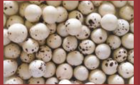
Çikolatalı Leblebi Chocolate-flavoured chickpea