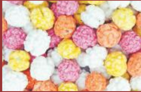
Leblebi Şekeri Sugar-coated chickpea