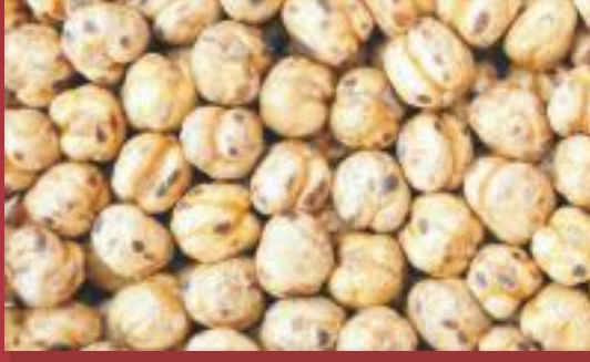
Dağlı Leblebi Harsh Chickpea